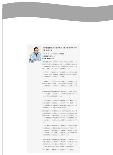
※記事はイメージ図です。